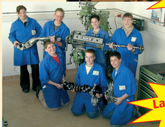
Schnittmodell: Sechszylinder Commonrail Diesel