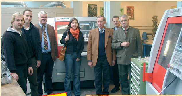
Technologie-offensive für den Lungau